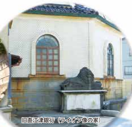
旧直江津銀行（ライオン像の家）