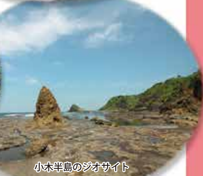
小木半島のジオサイト