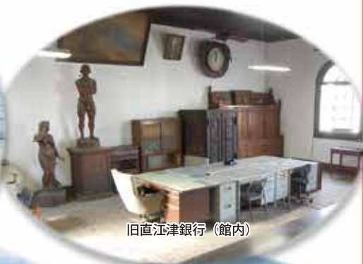
旧直江津銀行（館内）