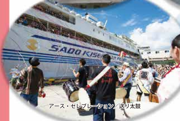
アース・セレブレーションズ/送り太鼓