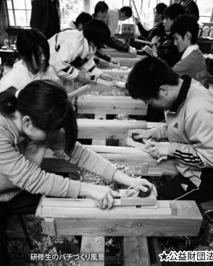
研修生のバチづくり風景