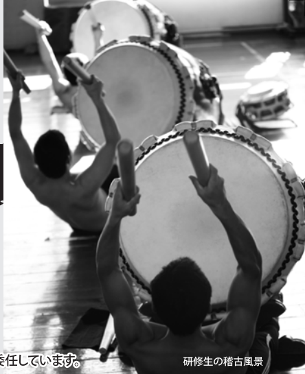
研修生の稽古風景