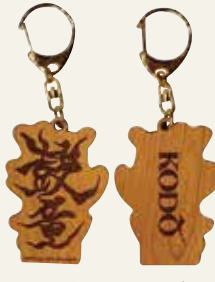
▲木製キーホルダー 価格1,500円(税込)