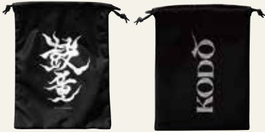
▲メッシュバッグ 価格2,500円(税込)