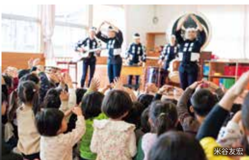
2024年12月 はじめての鼓童