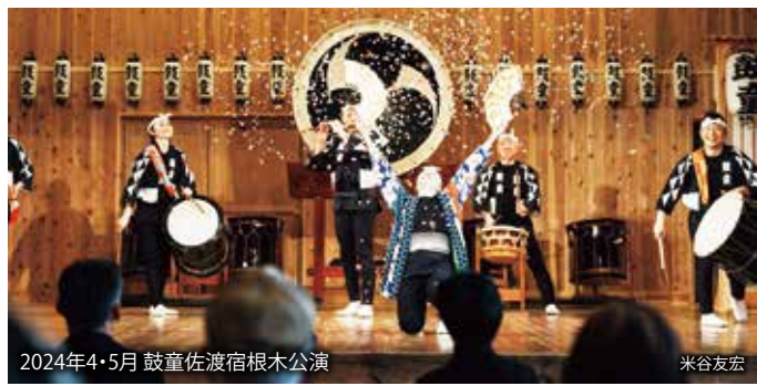
2024年4・5月 鼓童佐渡宿根木公演