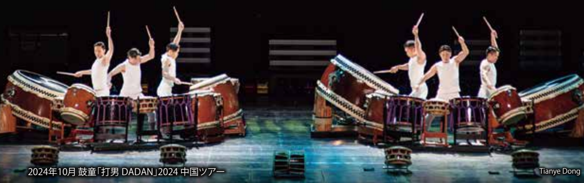
2024年10月 鼓童「打男 DADAN」2024 中国ツアー