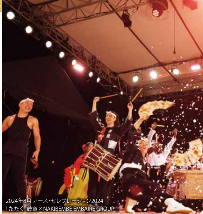
2024年8月 アース・セレブレーション2024 「たたく-鼓童×NAKIBEMBE EMBAIRE GROUP-」