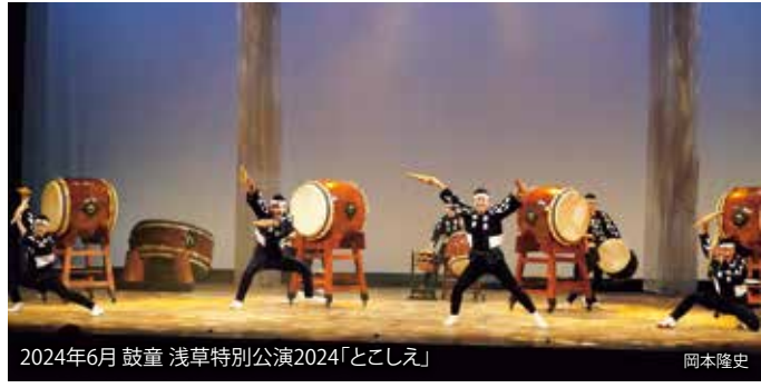
2024年6月 鼓童浅草特別公演2024「とこしえ」