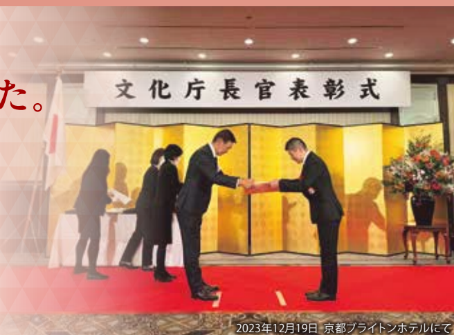
2023年12月19日 京都ブライトンホテルにて

今回の表彰を大きな励みとして、鼓童はこれからも世界各地への「ワン・アース」の旅を続けてまいります。