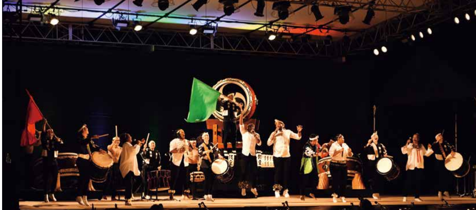
2023年8月 アース・セレブレーション2023 「祝祭 鼓童×The Voices of South Africa」