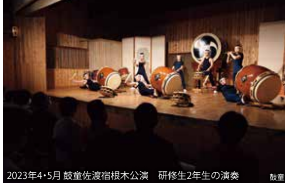
2023年4・5月 鼓童佐渡宿根木公演 研修生2年生の演奏 鼓童