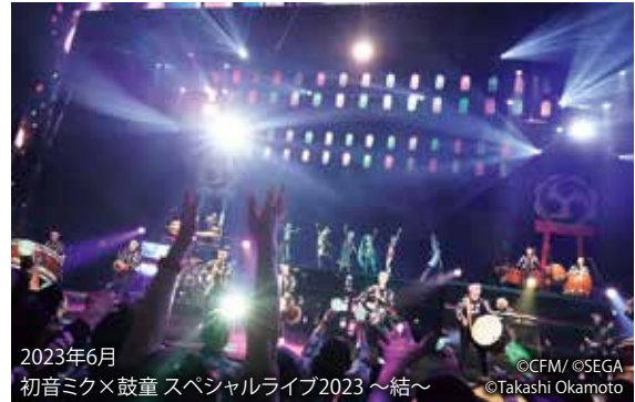
2023年6月 初音ミク×鼓童 スペシャルライブ2023 ～結～