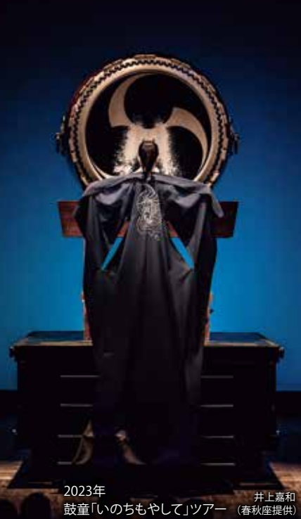
2023年 鼓童「いのちもやして」ツアー 井上嘉和 (春秋座提供)