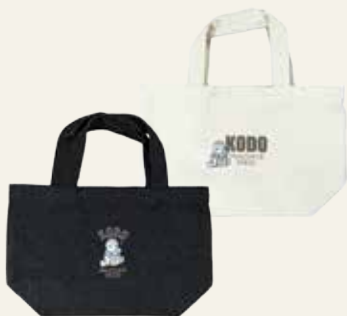
サイズ:縦190×横200×奥行き100mm カラー:ナチュラル/デニム

Kodo Heartbeat Radio ファンの方必見!! お馴染みのキャラクターが、遂にグッズとして登場。ランチバッグやちょっとしたお出かけにぴったりサイズのトートバッグです。2月中旬より各カラー50枚の数量限定発売となります。