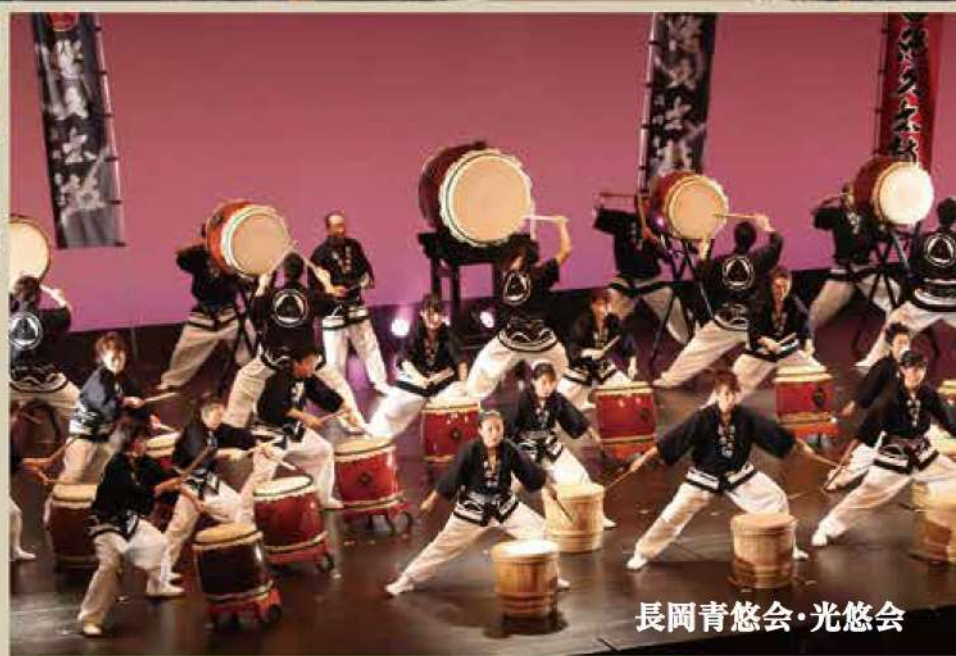
長岡青悠会・光悠会

オープニング～ 悠久太鼓 長岡光悠会 悠久太鼓 長岡青悠会 〈休憩〉 鼓童 鼓童×悠久太鼓 長岡青悠会・光悠会 合同演奏 ～フィナーレ ※16:30終演(予定)