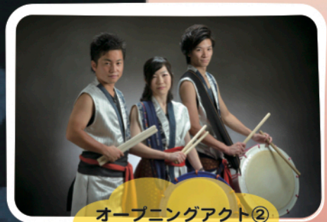
オープニングアクト② 鞆〜Link〜 (南予和太鼓ユニット)