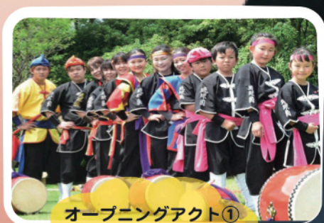
オープニングアクト① 琉球國祭り太鼓 愛媛支部