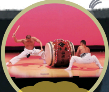
三宅島芸能同志会