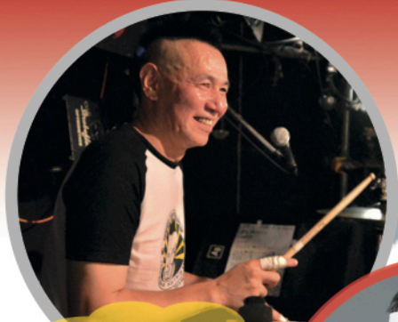
元ブルーハーツドラマー 梶原徹也