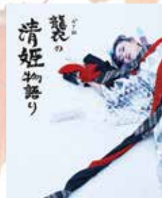
A4変形 全32ページ 2,500円

神戸市出身。 阪神淡路大震災の復興活動の一環で幼少期より和太鼓に親しみ 鼓童では太鼓の他に、唄や鳴り物など幅広い楽器を演奏する。 また、作曲活動のほか『アースセレブレーション』等 舞台演出の実績がある。