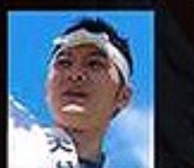
山岡太夫 綱三四郎